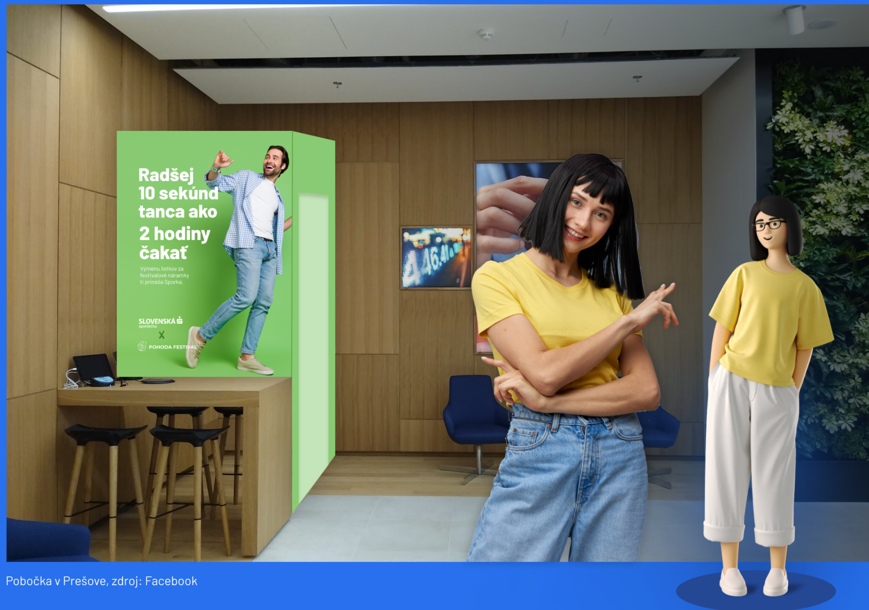
Pobočka v Prešove

Pre tých, ktorí sa ponáhľajú, budeme mať „náramkomaty“. Po naskenovaní QR kódu im automat vydá náramok. A to všetko bez nutnosti asistencie zamestnancov SLSP.