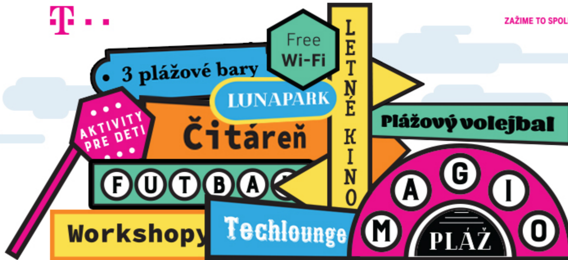
Facebook cover photo